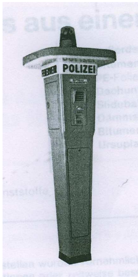
Abbildung 4: Polizeirufsäule (PRS)

Dass es sich bei der Beziehung zwischen Bevölkerung und Polizei nicht um eine Kundenbeziehung handelt, kann man sich auch an den seit den fünfziger Jahren im öffentlichen Raum aufgestellten Polizeirufsäulen 9 verdeutlichen, die den Zweck hatten, dass sich der „Bürger ... in allen Anliegen - seien es Hilfeersuchen, allgemeine Auskünfte oder sachdienliche Hinweise - direkt an die Polizei ... wenden“ (Hoffmann 1959: 96) konnte. So war „jede Frage, auch die nach einer Hausnummer oder Sehenswürdigkeit, zugelassen.“ (Gramatte 1978: 243)